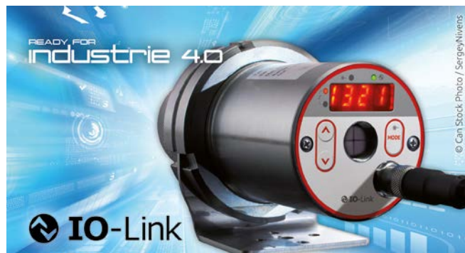
Pirometro a rapporto CellaTemp® PX 40 con mirino passante e ottica focalizzabile

Per ridurre al minimo l'influenza delle incrostazioni e dell'ossido sulla misurazione, è stata sviluppata la cosiddetta funzione CSD (Clean Surface Detection). Basandosi sul metodo di misurazione del quoziente e su un tempo di misurazione molto breve, l'algoritmo software della funzione CSD nel pirometro è in grado di filtrare in modo specifico i valori misurati della superficie priva di scaglie e ossidi. Più alta è la qualità dell'ottica e più alta è la risoluzione ottica, cioè più piccolo è il campo di misura del pirometro, più è probabile che il pirometro rilevi piccoli punti caldi. Quando il materiale laminato passa davanti al pirometro, la temperatura reale dei punti puliti viene misurata automaticamente e visualizzata con la funzione CSD.