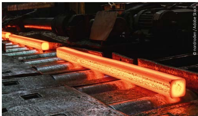
Le scaglie e l'ossido modificano in modo significativo le proprietà della radiazione

Le incrostazioni e l'ossidazione sulla superficie del materiale laminato influiscono notevolmente sull'accuratezza della misurazione ottica della temperatura nei processi di laminazione. L'emissività, cioè la capacità di irradiazione del materiale laminato, cambia di conseguenza in modo significativo. Tuttavia, una superficie scalare ha un'emissività maggiore rispetto a una superficie priva di scala. A seconda dei valori assoluti di temperatura, un pirometro convenzionale può