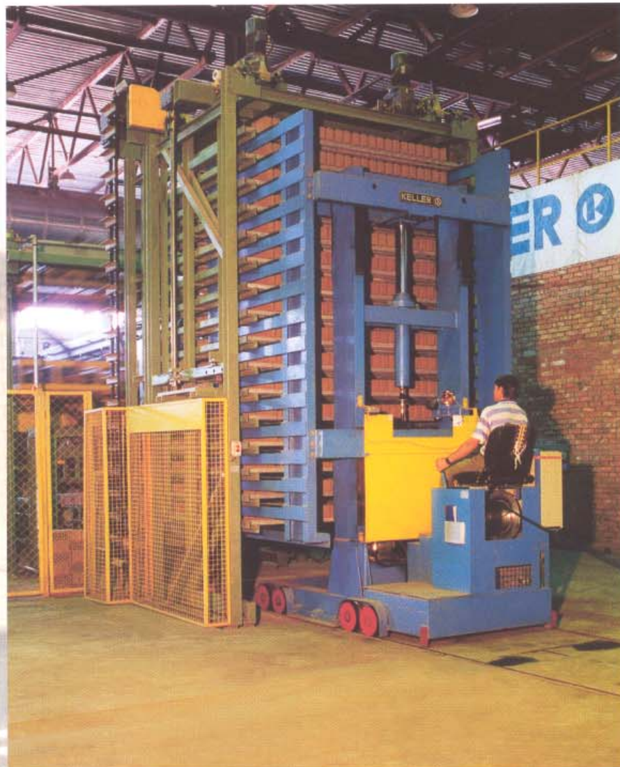
Накопительный каркас и транспортная тележка

Nach dem Trocknen werden die Formlingsträger mit den getrockneten Formlingen analog zur Naßseite mit dem Absetzwagen aus der Kammer herausgefahren und dem Sammelgerüst an der Trockenseite zugeführt. Hier wird dem Senkrechtförderer wiederum ein Stoß übergeben, der dann die einzelnen Formlingsträger der Gruppierautomatik übergibt. Hier werden die Formlinge justiert und der Gruppierautomatik zugeführt und gruppiert.