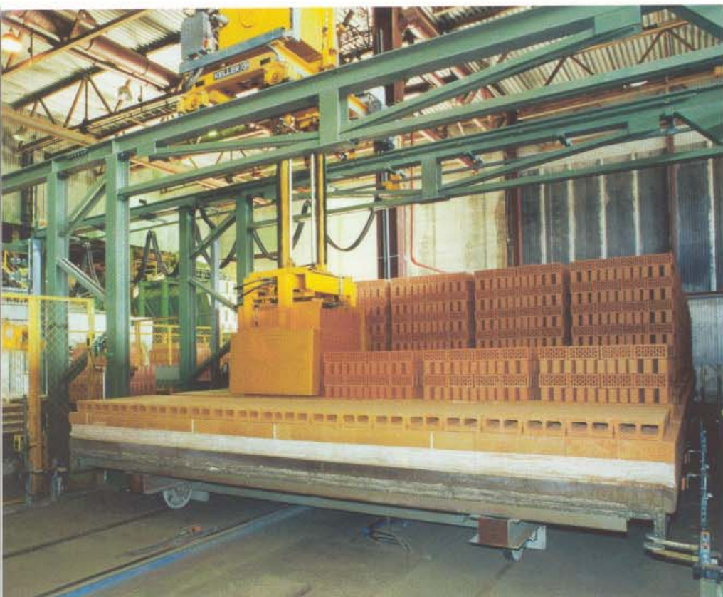
Участок разгрузки печных вагонеток Abnahme der gebrannten Ziegel vom TOW

Захваты разгружают вагонетки и укладывают восемь рядов готовой продукции на поддоны размером 1.000 x 1.000 мм. Не сформированные ряды собираются на вагонетке в комплексный пакет.