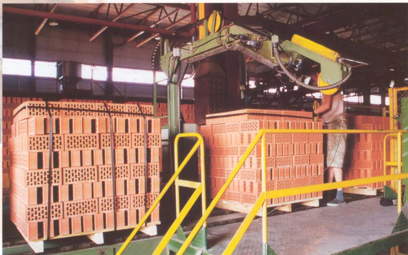
Полуавтоматическая обвязка стальной лентой Halbautomatische Umreifung mit Stahlband