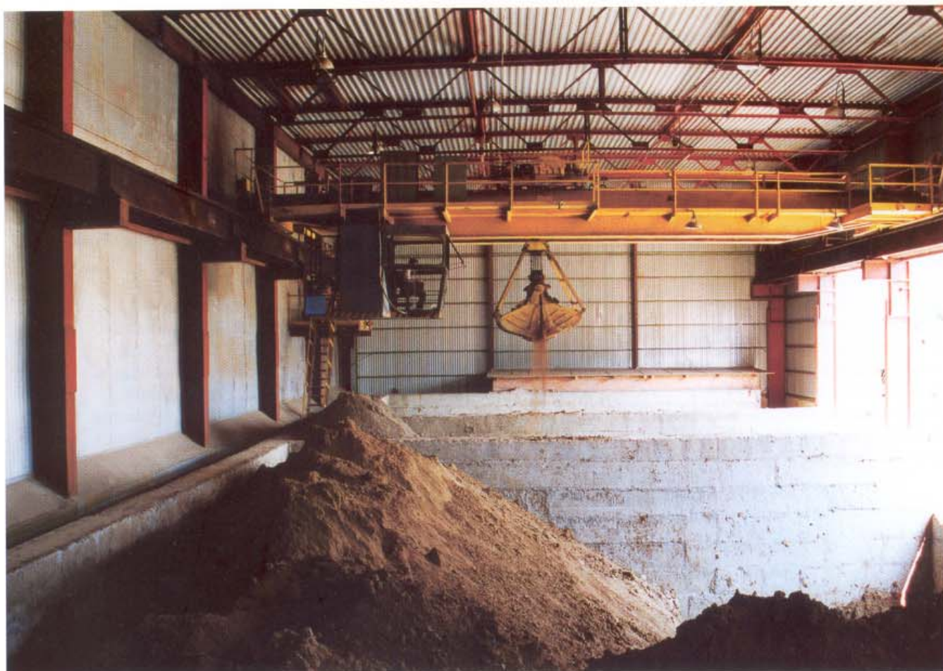
Склад сырья с мостовым краном Rohmateriallager mit Brückenkran