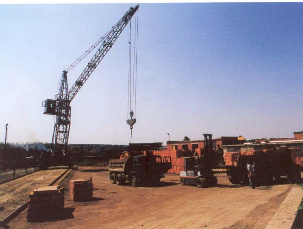
Склад готовой продукции