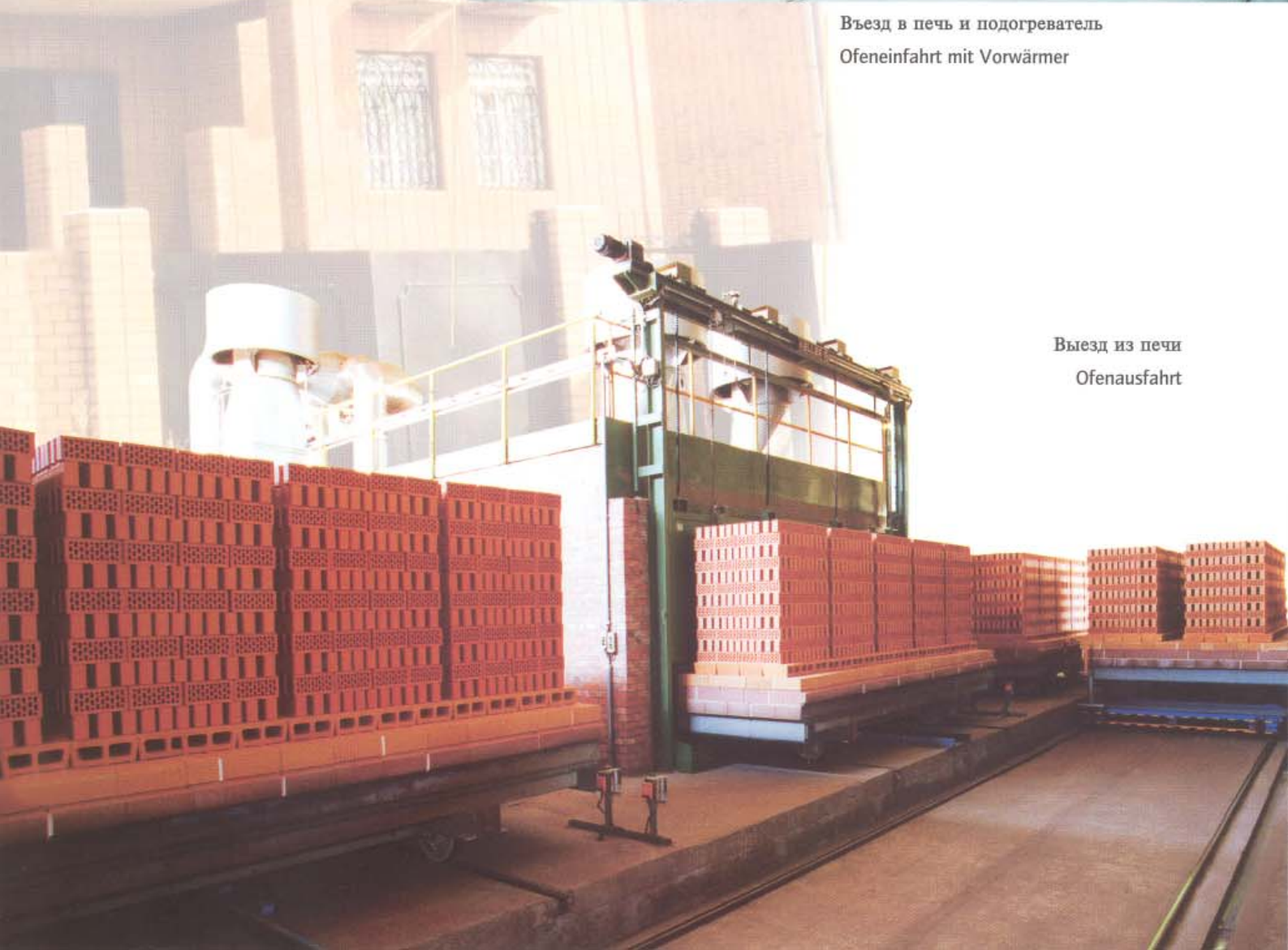
Выезд из печи Ofenausfahrt