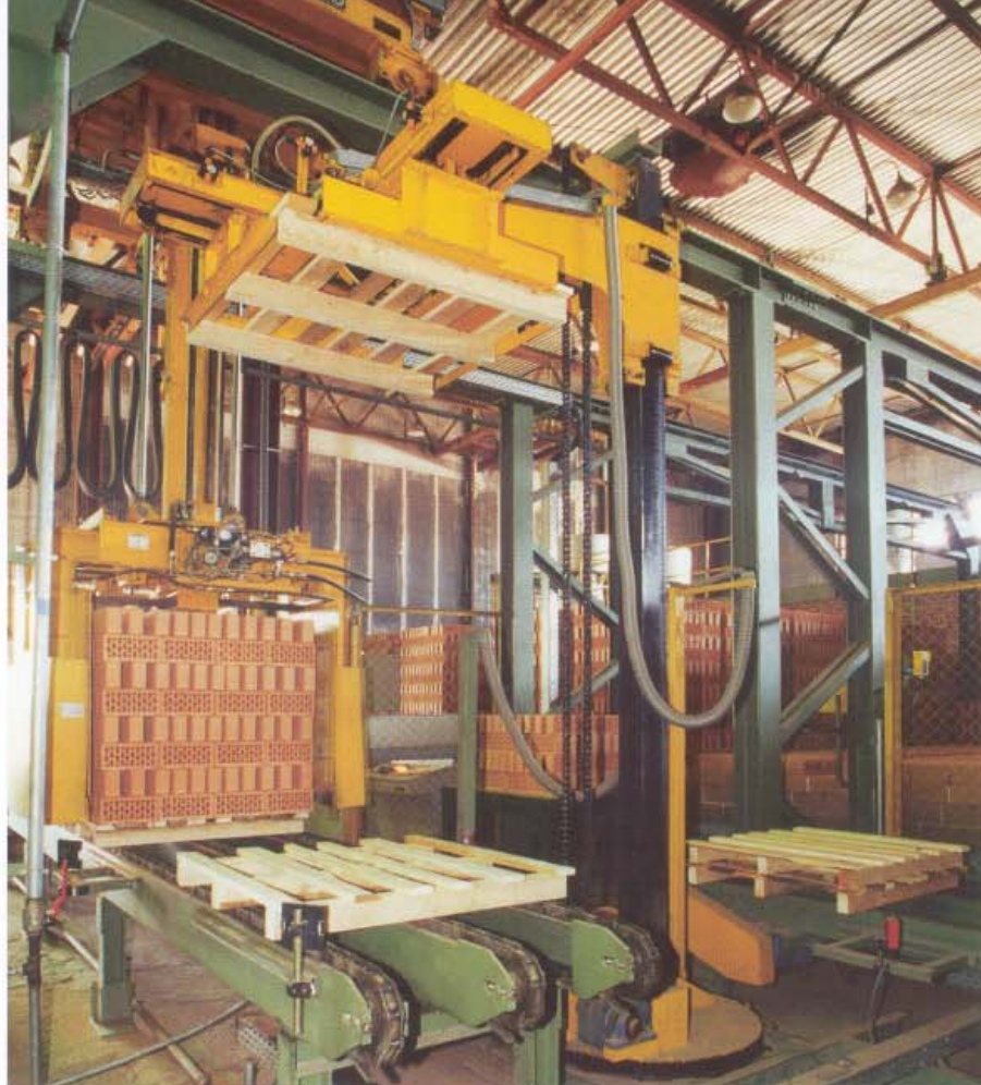
Участок подачи поддонов Zufuhr der Versandpaletten

Mit Gabelstaplern werden dann die fertigen Pakete von der Magazinbahn abgenommen und verladen oder im Lager gestapelt.