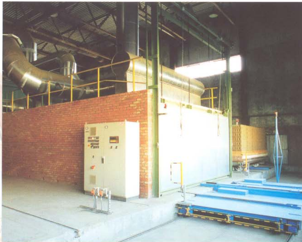
Въезд в печь и подогреватель Ofeneinfahrt mit Vorwärmer

Brennzeit: ca. 60 h Besatzhöhe: ca. 1.440 mm Besatzbreite: ca. 5.420 mm