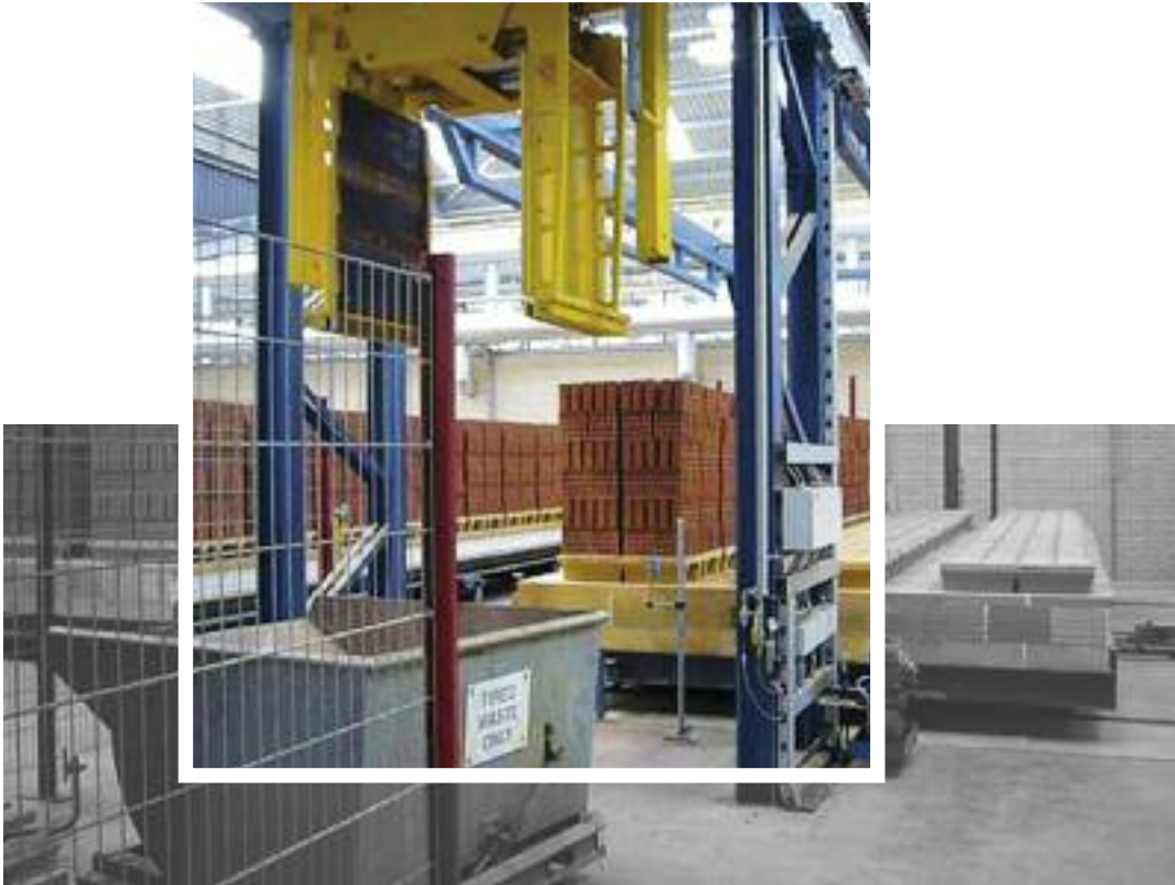
Paketweise Entladung der gebrannten Ziegel vom Ofenwagen