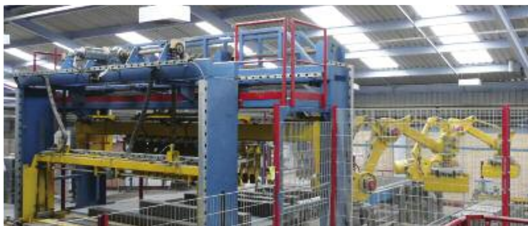
Module for setting preparation and 2 setting robots