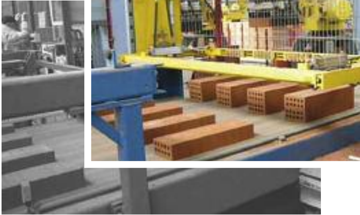
Auflösen des Besatzschemas vor der Sortierstrecke

Separating of the setting pattern before the sorting line