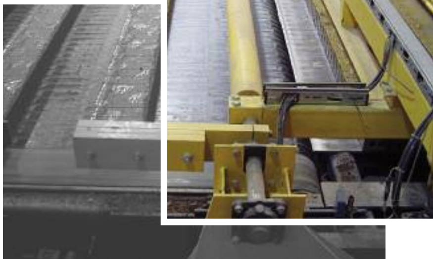
Durchhubabschneider mit anschließendem Förderband

Before the modernisation, the site in Throckley manufactured a total number of 27 different facing bricks from 5 different clay materials with a wide range of surface treatments and had a total plant capacity of 50 million bricks per year. As the existing plant no longer met the present-day requirements, it was decided to build a new plant with the same production range but with a considerably increased capacity.