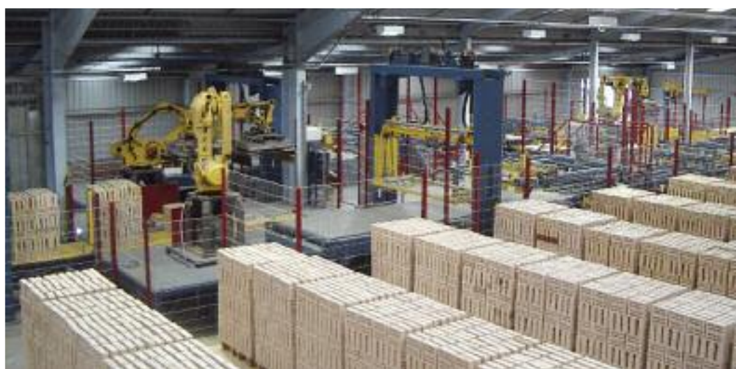
Entladungs- und palettenlose Verpackungsanlage