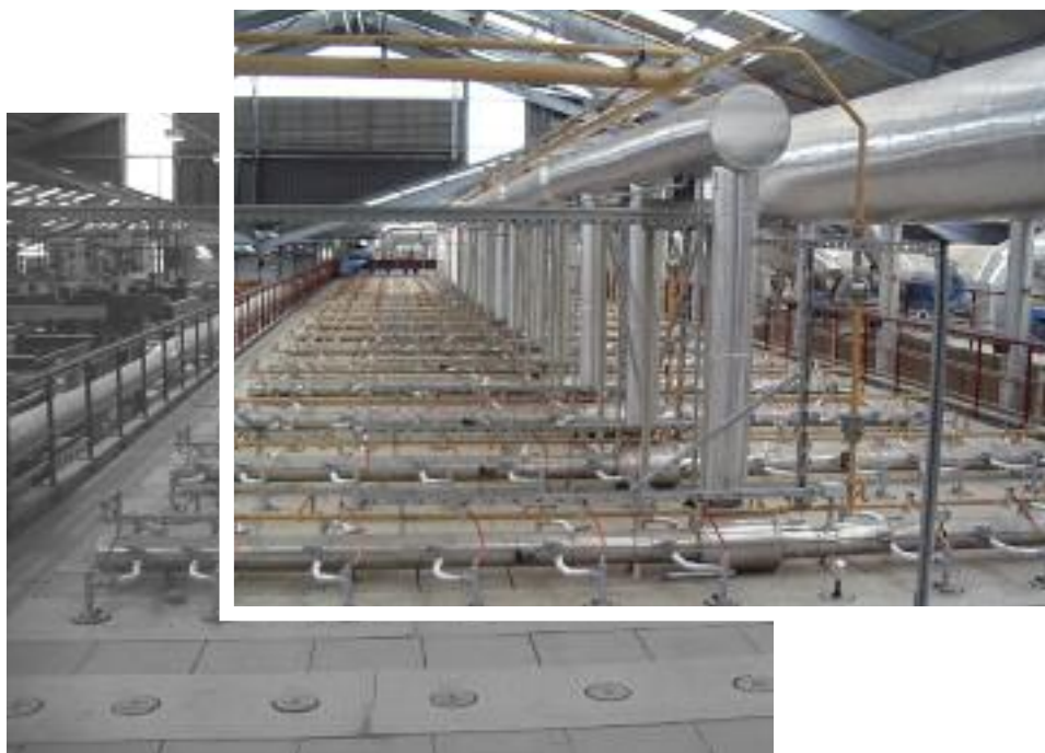
Brenneranlage auf dem neuen Ofen